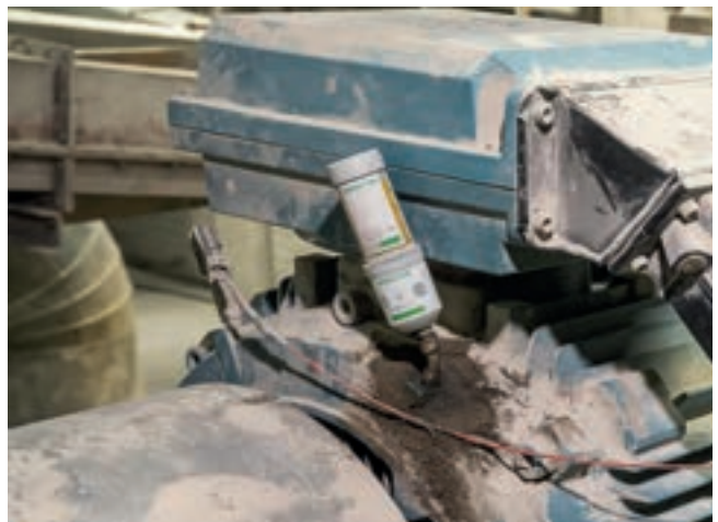
윤활 솔루션 시멘트: OPTIME C1은 정확하게 윤활되며 스마트 기술을 통해 위치에 관계없이 항상 (모바일) 단말기에 상태를 표시합니다.