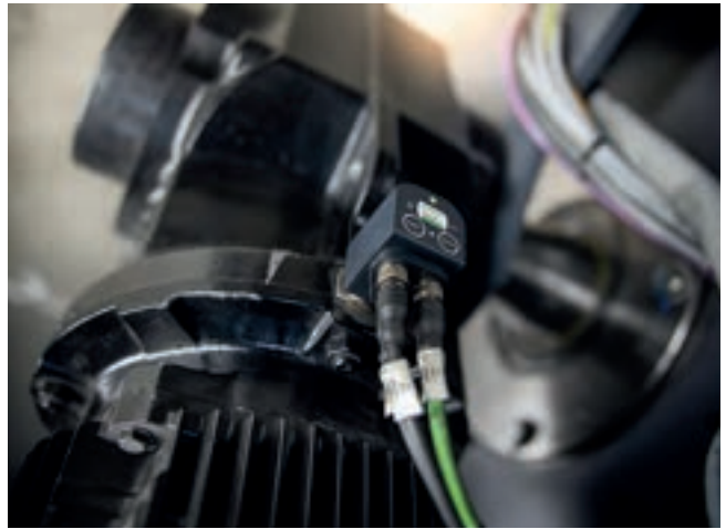
컨디션 모니터링 솔루션 물류 센터: SmartCheck를 통한 랙 피더 모터 모니터링