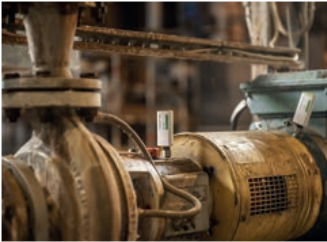
컨디션 모니터링 솔루션 제지 공장: OPTIME를 통한 우수한 모터, 펌프 모니터링