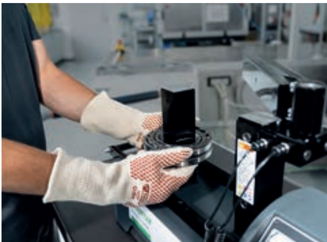
산업용 도구 - 어셈블리 산업: HEATER는 부드러운 유도 가열을 통해 고르지 않은 작동, 균열 또는 마모 자국 등의 손상을 방지합니다.