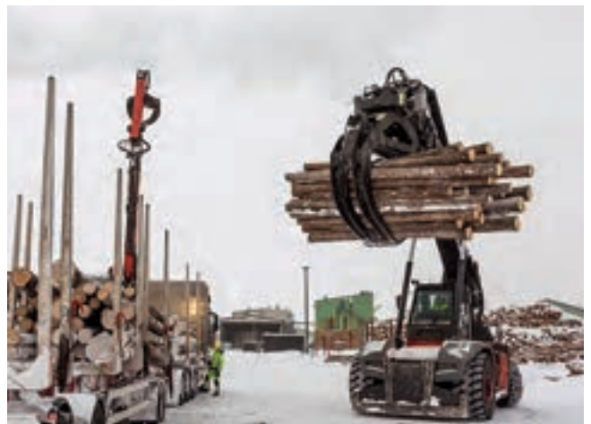
Norra Timber 제재소, 20,000유로 절감 SmartCheck 모니터링 솔루션을 통해 더 이상 원치 않는 가동 중지 시간 방지