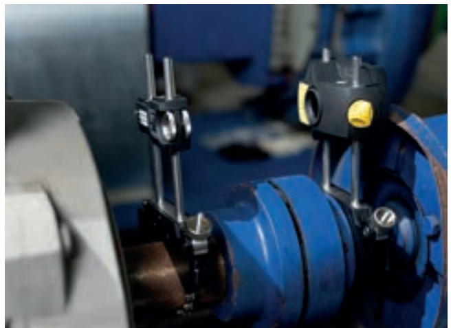
산업용 도구 - 정렬 산업: LASER-EQUILIGN2는 단일 레이저 기술을 통해 항상 설비의 전문적인 정렬을 보장합니다.