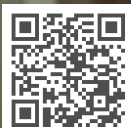
단 한 번의 공장 장애 방지로 47,000유로 절감 위치에 관계없이 윤활유 주입량 주시