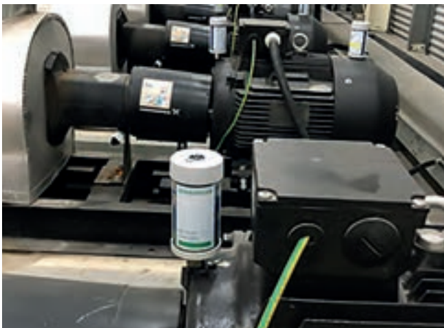
윤활 솔루션 산업: CONCEPT1을 통한 대량의 모터 윤활